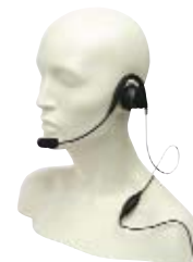
RMN5015 — Сверхпрочная гарнитура (требует кабеля–адаптера гарнитуры RKN4090)