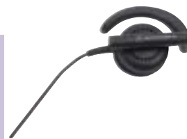
BDN6720 – Головной телефон с жесткими ободами

16-канальная радиостанция CP140 — отличный выбор для работников небольших организаций, которым необходима постоянная и экономичная связь с коллегами и руководством. Пользователи могут переключаться на дополнительный канал, чтобы обсуждать более сложные вопросы один на один.